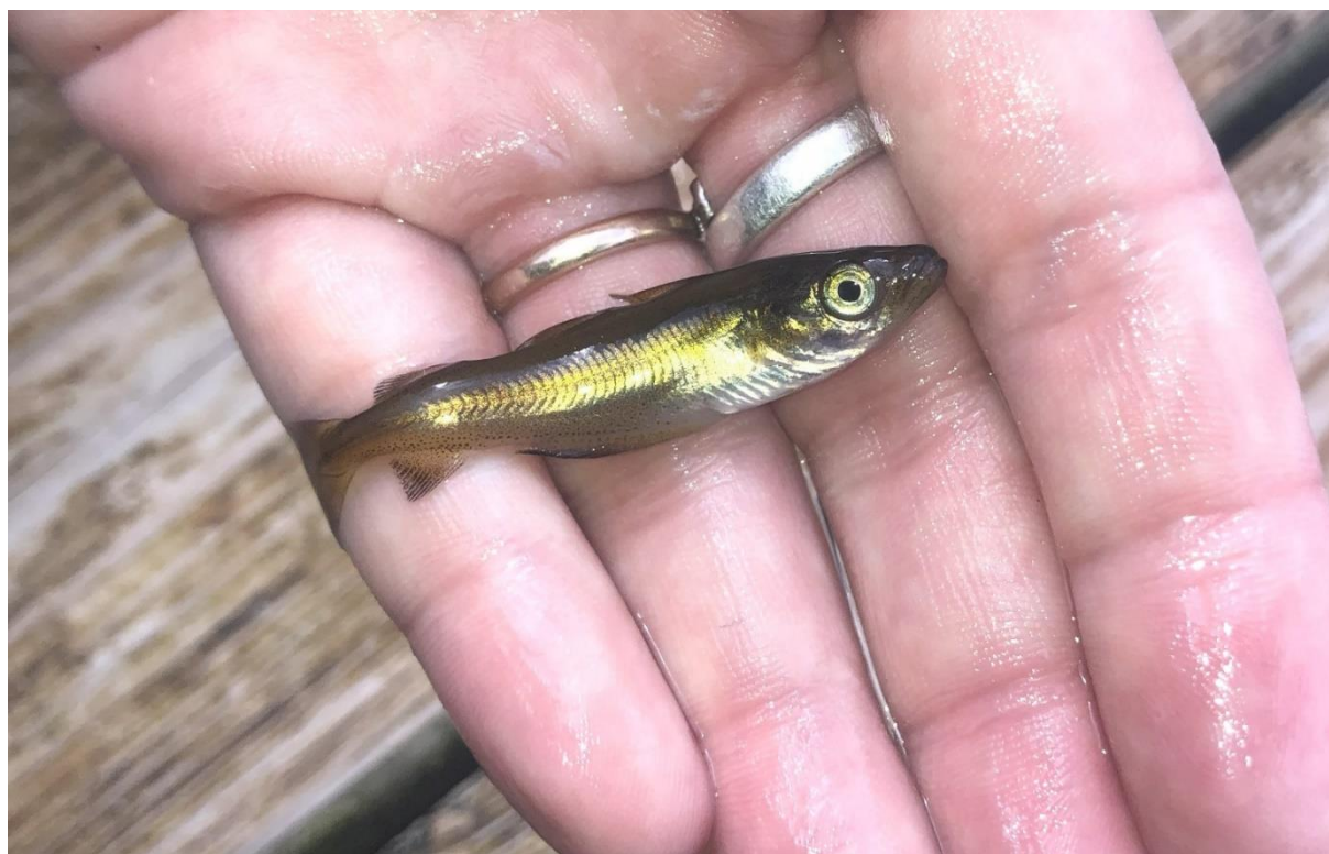
Figur 1: Yngel av en torskefisk, muligens lyr, fanget på stranden i Torbjørnsbukta, Borlaug, Feios den 26. juni 2023.