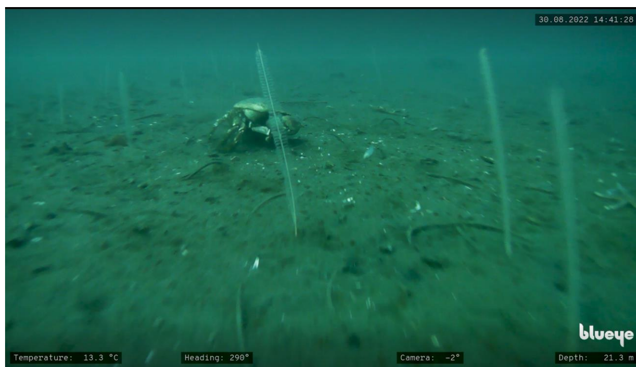
Figur 1: Sjøfjær fra 21 m dyp i Lærdalsfjorden 30. august 2022.